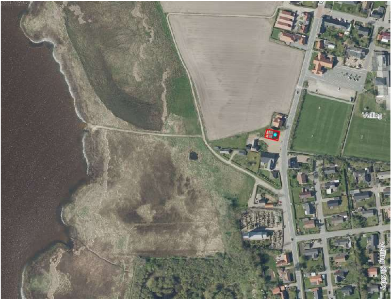
Flyfoto af området med bygningen for ansøgningen markeret (rød)